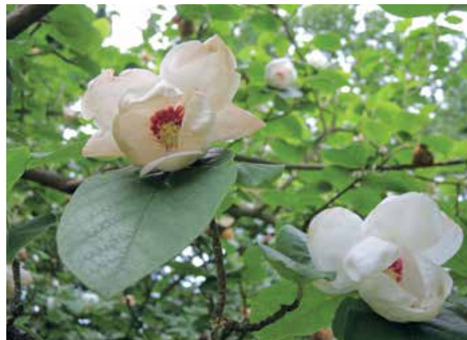
▲ Magnolia sieboldii 'Colossus' groeit uitstekend op de vochtige, lemige grond