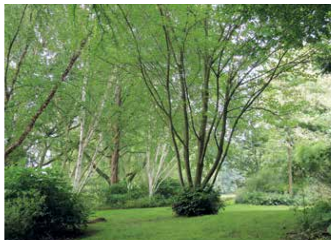
▲ Achter de beukenberceaus zijn alle vegetatielagen aanwezig, een rijke variatie aan botanische bijzonderheden