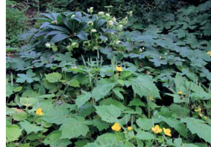
▲ Zelfs in diepe schaduw groeien de mooiste soorten zoals Helleborus en bosklapros ( Hylomcon japonica , syn. Chelidonium japonicum ), die thuis hoort in berggebieden in Korea en Japan