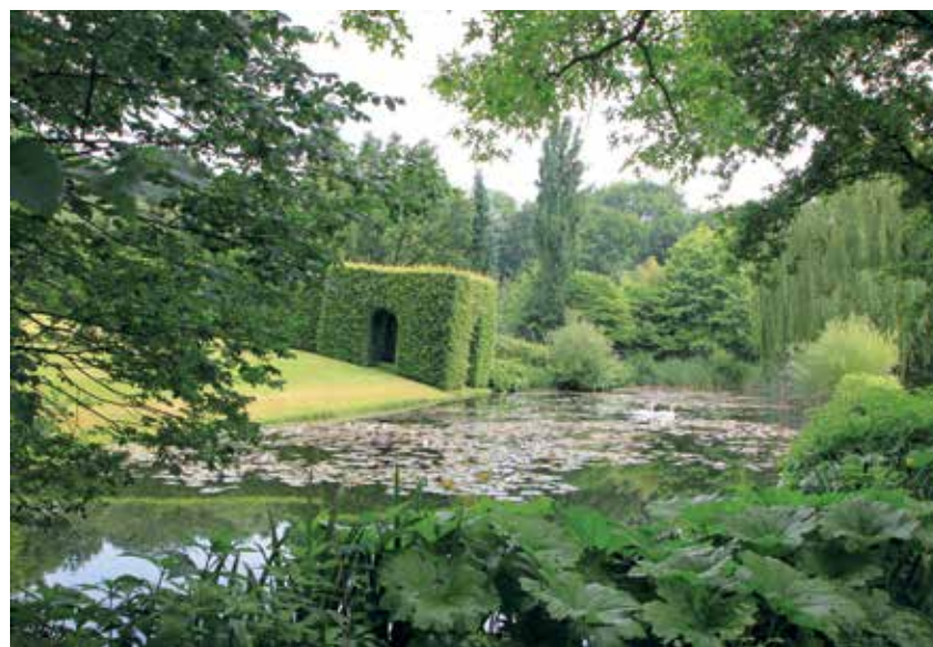
▲ De grote vijver markeert het eerste tuindeel

Behalve bijzondere planten heeft Fox Hill sterke architecturale elementen. Zodra het huis met Engelse stijlen gereed was, namen Thérèse en Benoît Devos in 1985 de tuinarchitect Paul Deroose in de arm voor een ontwerp. Hij gaf de tuin esthetische allure met strak gesnoeide haagbeukenberceaus. In 1999 kreeg de tuin in de lengte een uitbreiding, waarvoor tuinarchitect Erik De Waele een plan maakte met verschillende natuurlijke vijvers. Een spectaculair accent in het lager gelegen tuindeel is 'Stonehenge', een sculptuur van taxus met een ring van lavendel.