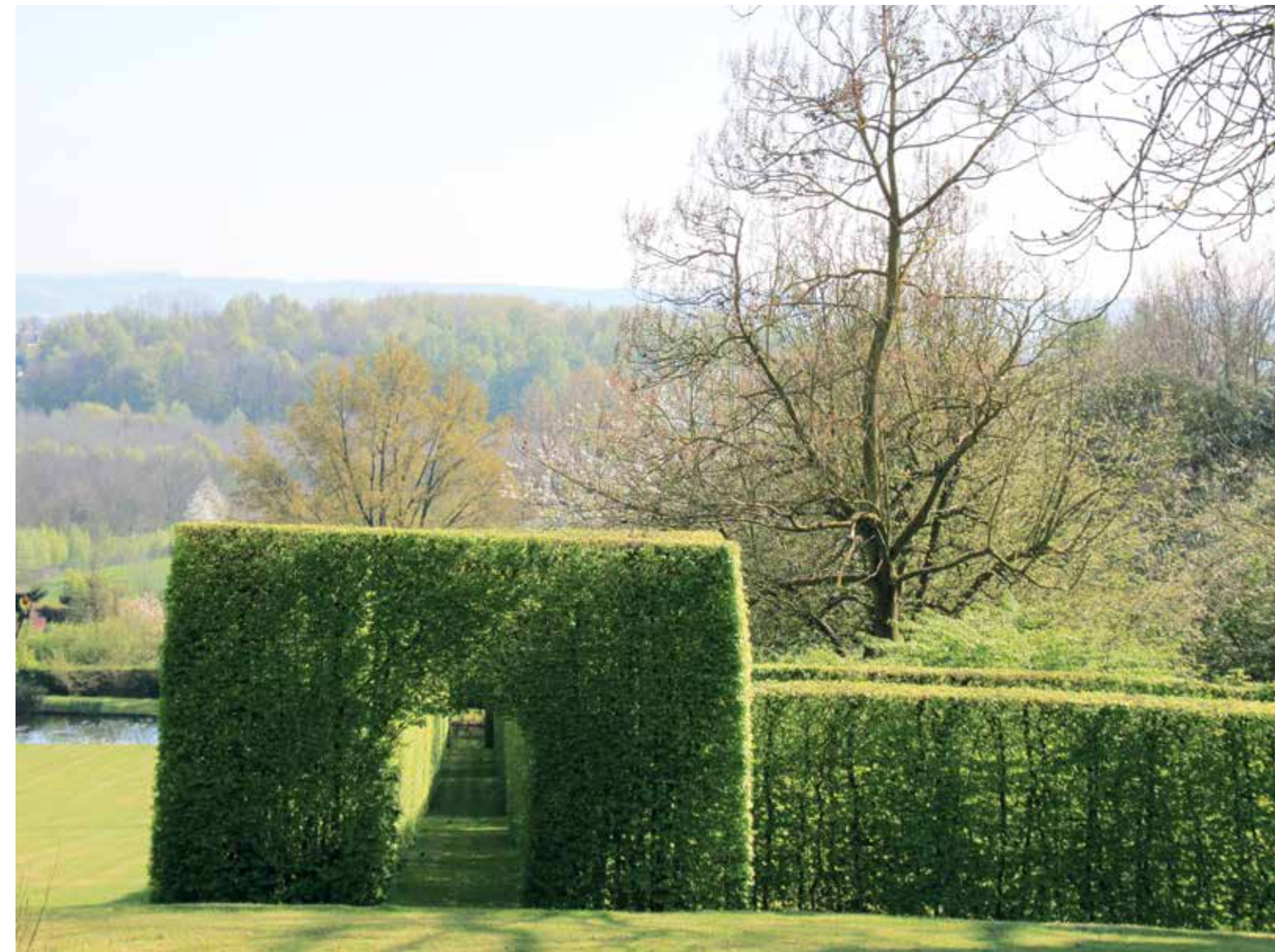
▲ De strak geschoren berceaus leiden naar een grote vijver en vormen een spannend contrast met het omringende landschap

Damien Devos heeft als kind zijn eerste kweekervaringen opgedaan in de tuin van zijn ouders, Fox Hill. Dit 4 hectare grote domein ligt tegen de zuidflank van de Tiegemberg (Anzegem, België), een sterk glooiend bosgebied op de grens van de Vlaamse Ardennen. Vanuit het huis met ruim terras is een adembenemend vergezicht op het omringende landschap en het dorp Tiegem. De zuidhelling biedt beschutting tegen koude noordenwind, zodat zelfs gevoelige plantensoorten er kunnen gedijen.