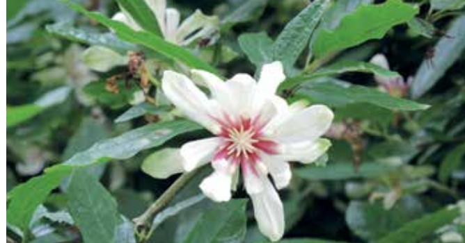
▲ Calycanthus 'Venus' is een bijzondere, grootbloemige vorm van specerijstruik