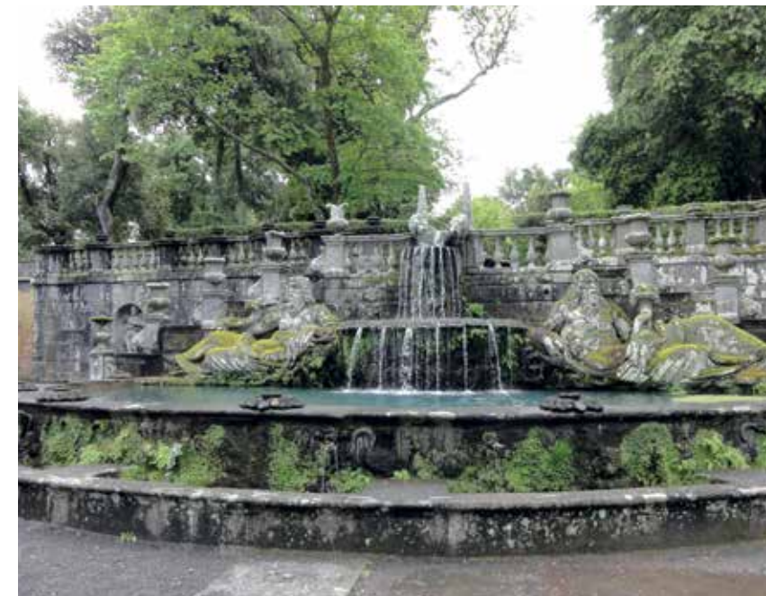
▲ De symmetrische fontein van de Reuzen (5) met de Arno en de Tiber als riviergoden