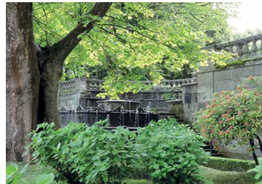
▲ De ronde fontein van de Lichtjes (7) is rijk aan decoraties waaruit waterstralen spuiten; sierheesters zoals hortensia's en azalea's behoren niet tot de authentieke beplanting

( Fontana di Luzerne ), waar de ronde vorm domineert. Uit kleine kommetjes op de randen komen 160 waterstralen omhoog. Met een vernuftig mechanisme konden gasten hier worden verrast door water uit verborgen spuitertjes! Bijpassende elementen zijn twee schelpengrotten, gewijd aan Venus en Neptunus. Dit terras is versierd met bloemheesters zoals rododendron, azalea's, camellia's en hortensia's, een meer recente toevoeging die feitelijk niet past in het authentieke concept. Dat is wel het geval met de mooie tuinvazen en balustrades die hier goed tot hun recht komen.