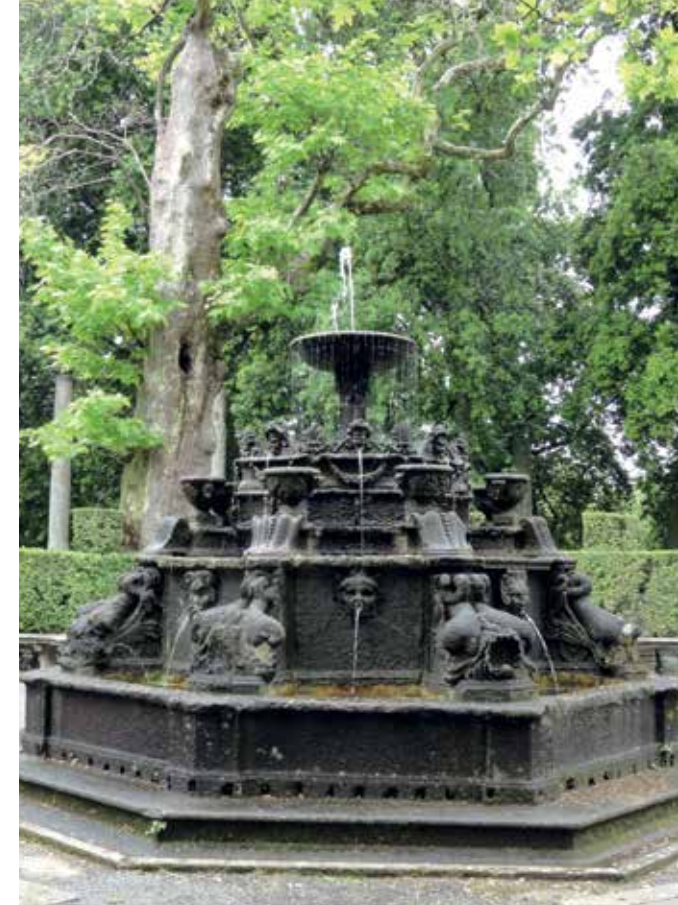
▲ De achthoekige fontein van de Dolfijnen (3) op het bovenste terras; dankzij ingenieuze ondergrondse techniek stroomt het water via de cascade naar de fontein van de Reuzen (5).