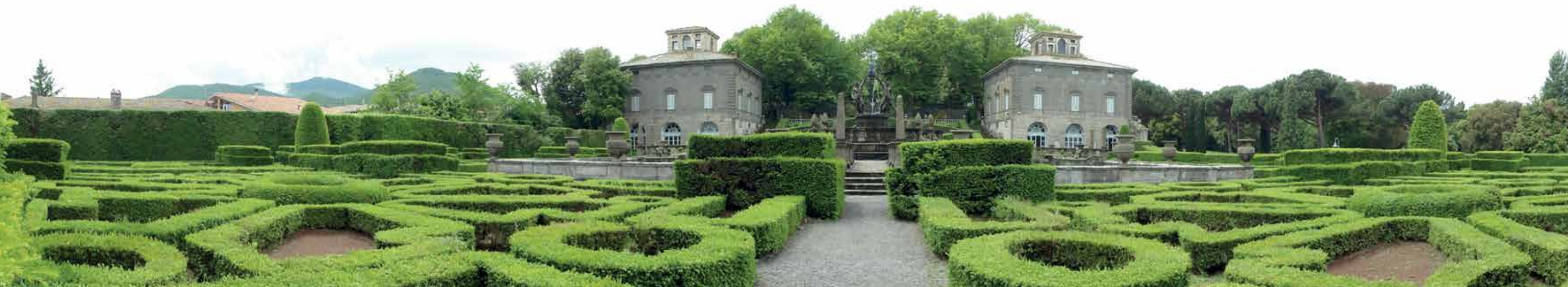
▲ Volmaakte symmetrie aan weerskanten van de wateras met fonteinen, gezien vanaf het laagste en grootste terras (12); rechts palazzina Gamba (10) dat als eerste werd gebouwd (entree tuin), links het identieke palazzina Montalto (11).

Villa Lante dankt zijn naam aan de Italiaanse familie die bijna drie eeuwen eigenaar en bewoner was (1656 - 1953).