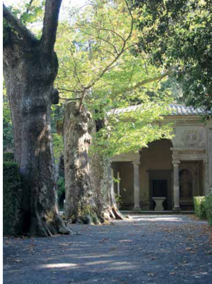
▲ Een van de twee paviljoens van de muzen (2) met loggia en arcade in de klassieke stijl van Palladio; op de gevel het wapen van Gambara