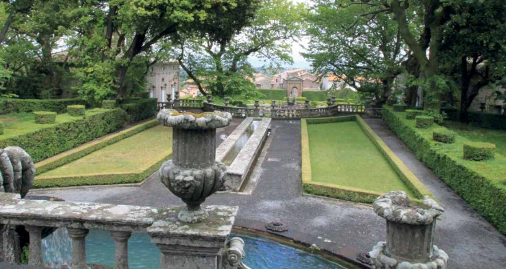
▲ De lommerrijke buitenkamer ( Mensa del Cardinale ) met watertafel (6), waarin tijdens banketten wijn en gerechten in drijvende schalen werden gekoeld; de watertafel markeert de wateras