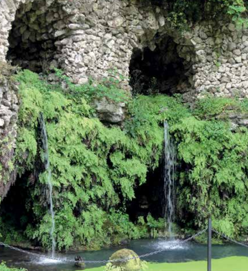
▲ Op het hoogste terras stroomt water via het Nymphaeum met grotten (1) de tuin in vanuit een onzichtbaar voorraadbassin; de poreuze peperino steen is rijkelijk begroeid met venushaar, een inheems varentje.