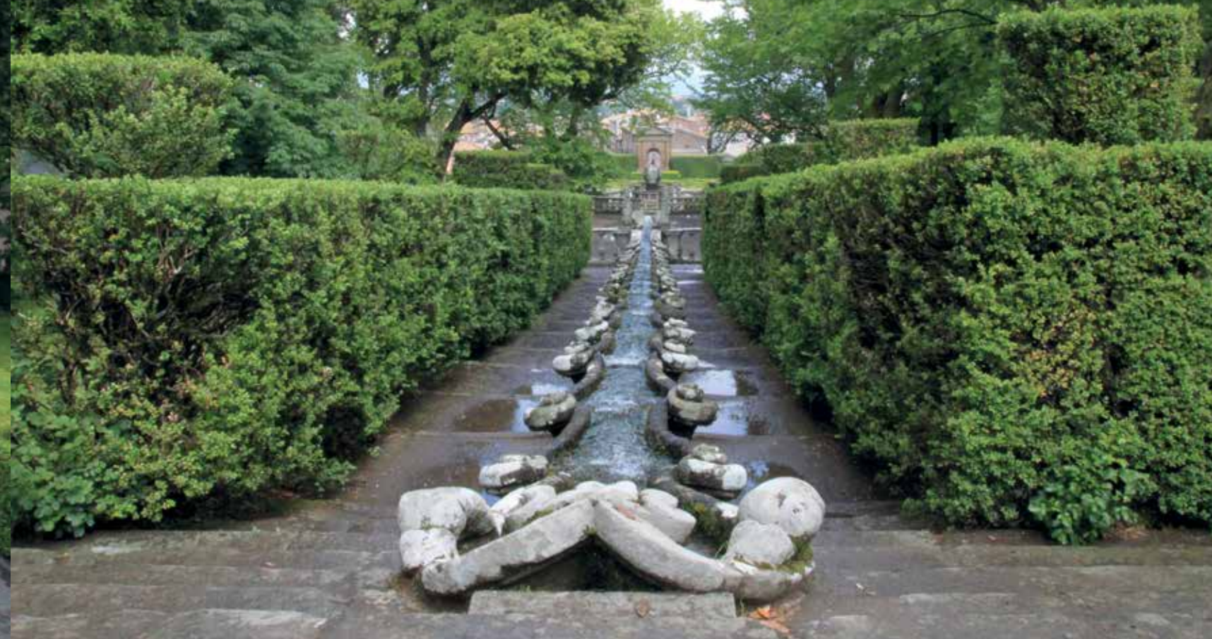
▲ De watergoot of cascade (4) heeft de vorm van een langgerekte kreeft, het wapenmotief van kardinaal Gambara; de cascade is onderdeel van de wateras en verbindt twee terrassen. In de verte is de historische hoofdepoort zichtbaar