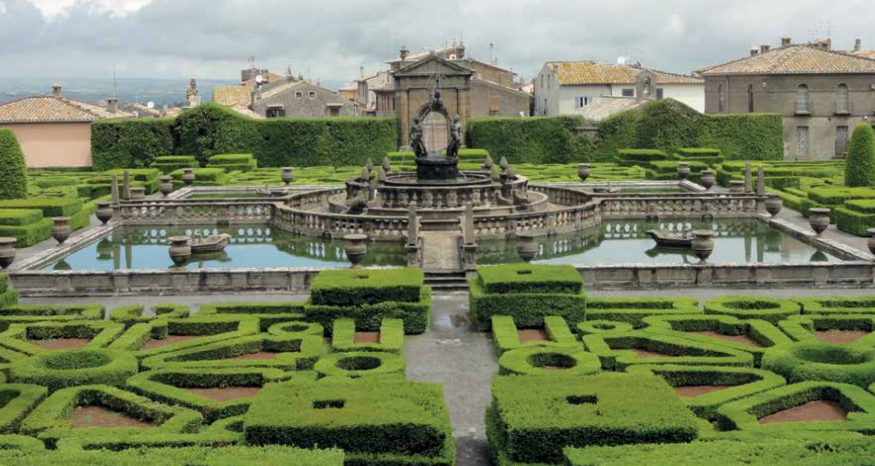
▲ De formele tuin met parterres de broderie op het laagste en grootste terras met watercompartiment en de fontein van de Moren (12); op de achtergrond de oorspronkelijke hoofdboort en de daken van Bagnaia